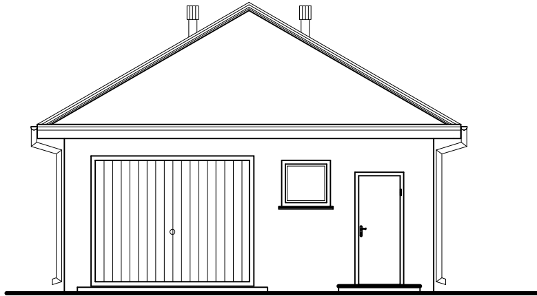
ELEWACJA ZACHODNIA SKALA 1:100